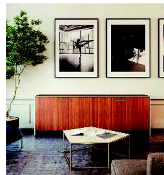
I Bleibender Eindruck: Eku-Frontino 20 verschließt Sideboards flächenbündig.

Ein weiteres Highlight wird der grundlegend überarbeitete Eku-Clipo für Holz- und Glastüren sein – jetzt mit unsichtbar in die Laufschiene integrierter Dämpfung und inklusive Selbsteinzug und Zuhaltung. (hf)