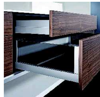
I Bringts zum Laufen: die bewährte Nova Pro Führungs-Technologie.

ein neuer geschlossener und damit besonders ästhetischer Box-Auszug in 186 mm Höhe. Das Nova Pro Scala Sortiment ist ab Herbst 2016 verfügbar. (hf)