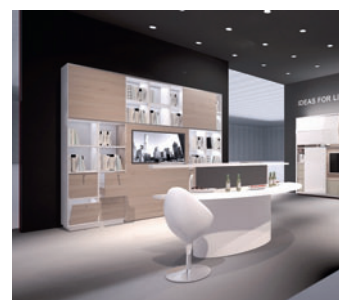
/ Raumstimmungen und Wohnwelten sollen erlebbar gemacht werden.